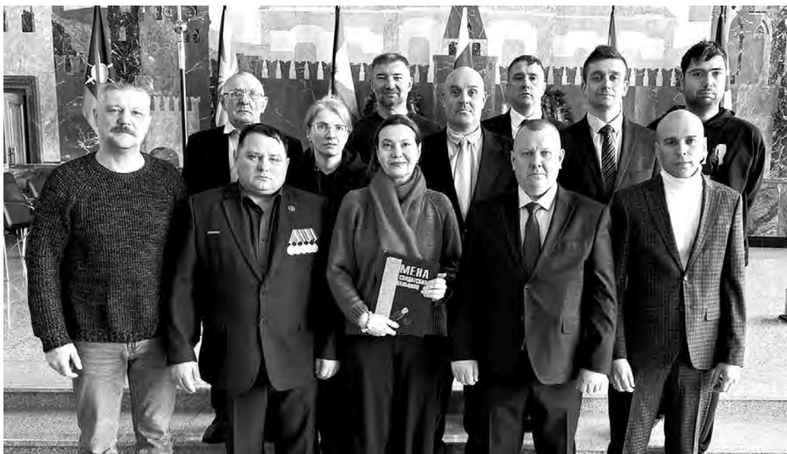
● Киришские и казанские поисковики на захоронении останков экипажа. 22.02.2026г., г.Мытищи