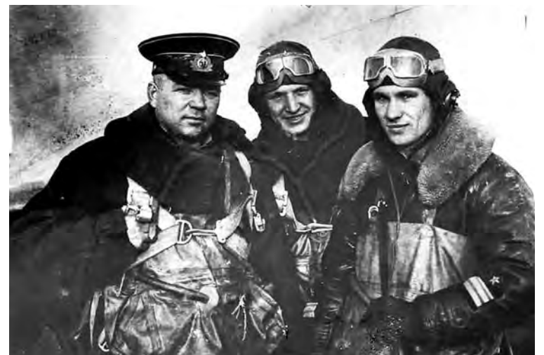
● Экипаж машины боевой...

Зимой 2005 года поступила информация о том, что местные будогощские парни на месте падения самолета нашли ремennую пряжку с якорем и звездой и фрагменты останков. Стало понятно, что кто-то из экипажа здесь погиб. Самолет оказался морской, что для наших мест довольно удивительно. Морская авиация в наши края летала крайне редко, в основном у нас работали полки армейской авиации. 8 января 2005 года группа поисковиков из отряда «Небо Ленинграда» выехала снова на