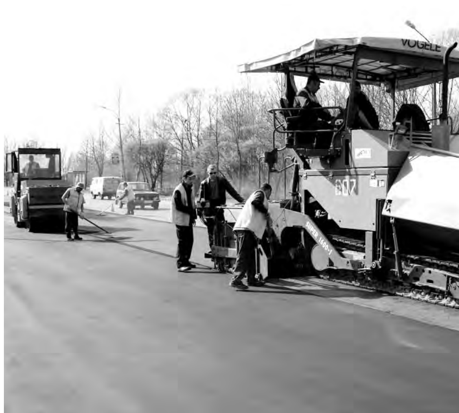
● Ремонт киришских дорог силами сотрудников ПМК-19. 2008 год