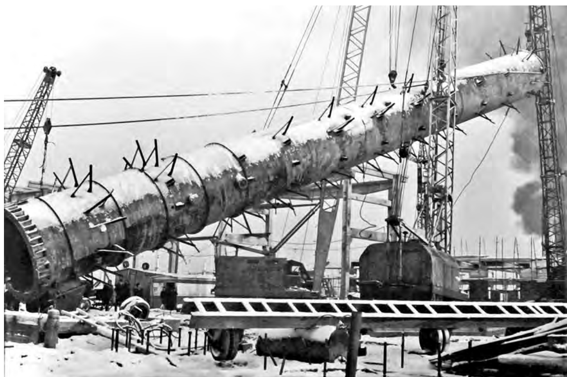
● Монтаж колонн блока стабилизации каталитического риформинга (установка Л-35-11/600)