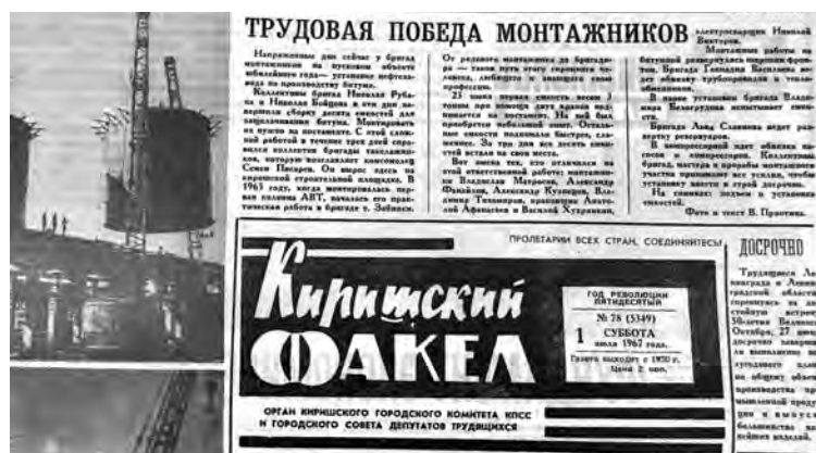
● В газете «Киришский факел» от 1 июля 1967 года материал о завершении работ на участке по производству битума