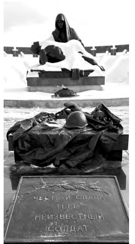
● Мемориальное кладбище в Мытищах