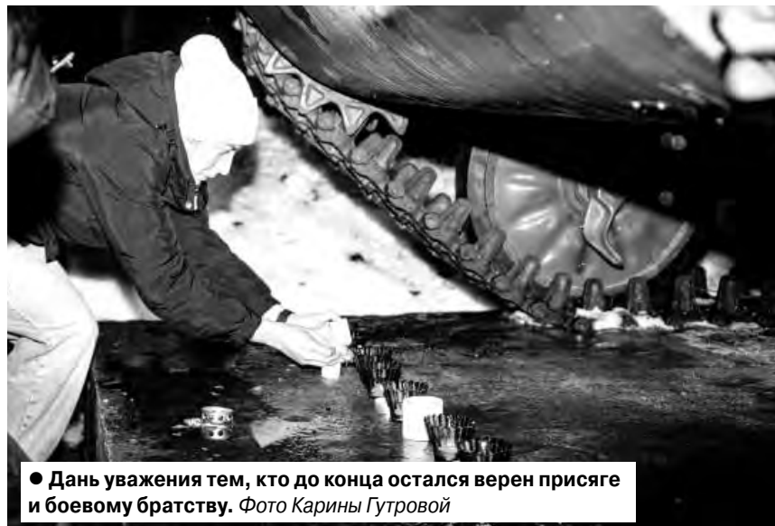
● Дань уважения тем, кто до конца остался верен присяге и боевому братству.

Во время акции в Киришах участники возложили цветы к подножию мемориала, почтив память героев минутой молчания. История о «непокоренной высоте» 776 остаётся живым напоминанием о том, что для русского солдата верность присяге и боевому братству дороже жизни.