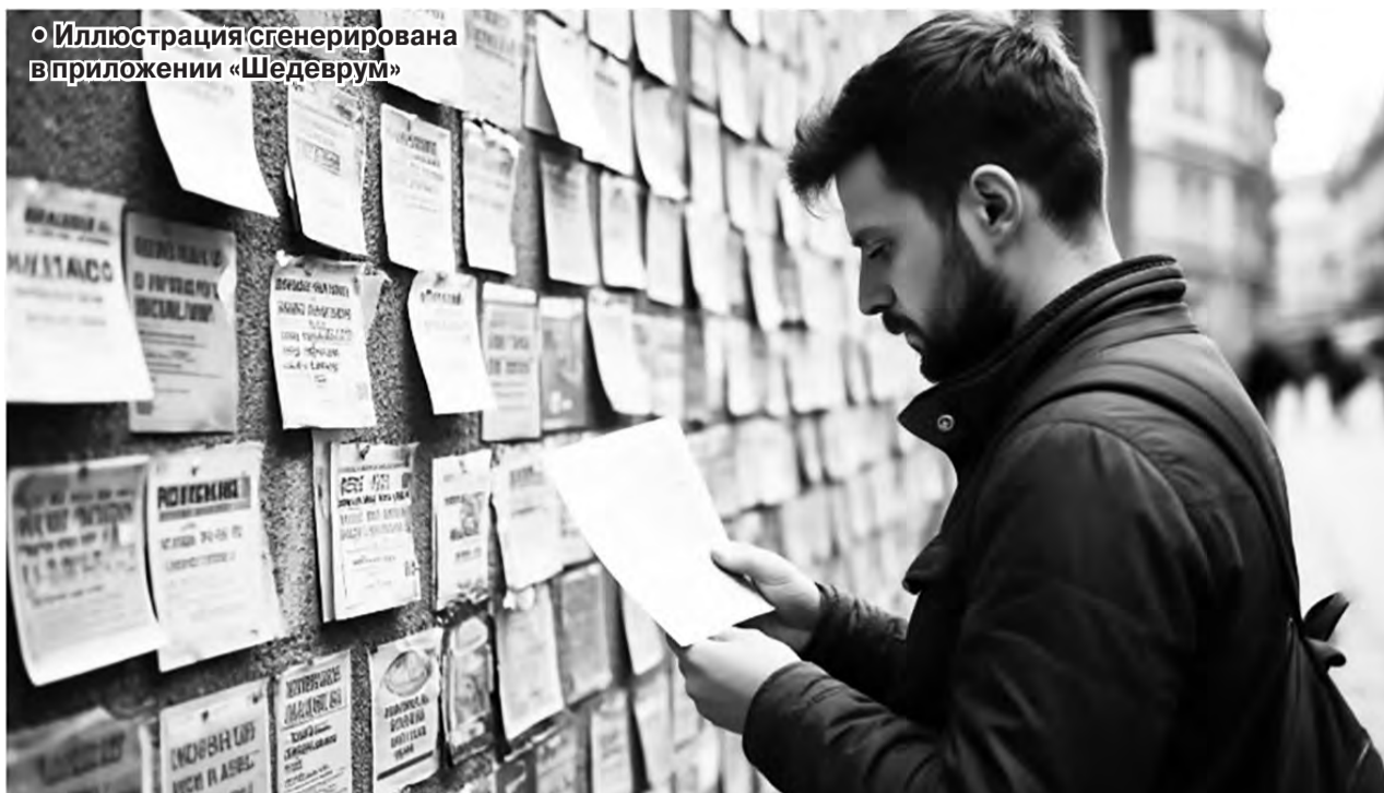
Иллюстрация сгенерирована в приложении «Шедеврум»