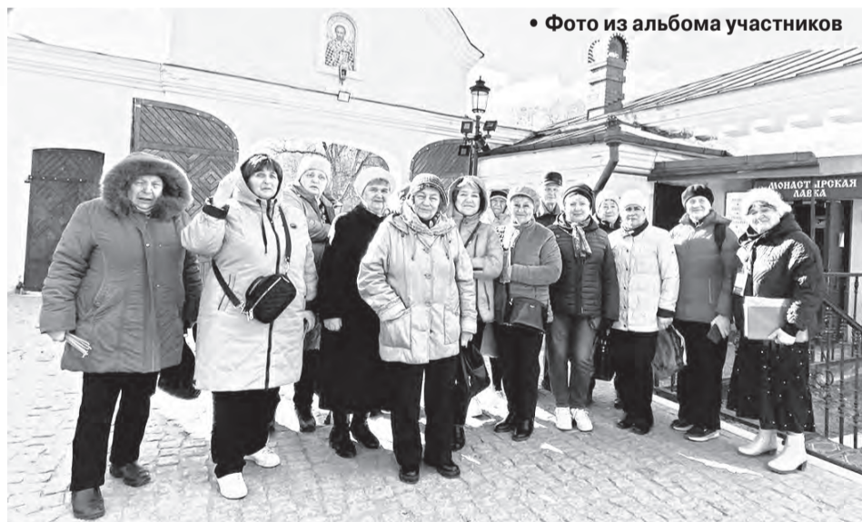
• Фото из альбома участников

«Было интересно увидеть своими глазами, как выпекаются батоны, хлеб, другие изделия, попробовать еще горячие всеми любимые сушки с маком. Побывали мы и в кондитерском цехе, где чудо-мастера делают красивые и вкусные торты и пирожные. Нас угостили чаем с вкусными пиро-